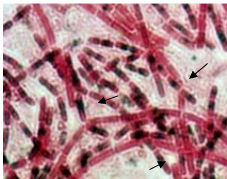
شکل (۱): گونه میکروبی به رنگ قرمز و گرانول‌های پلی‌هیدروکسی‌آلکانوات به رنگ آبی تیره

پس از رنگ آمیزی سودان سیاه و مشاهده بوسیله میکروسکوپ نوری با لنز ۱۰۰ گونه‌هایی که توانایی تولید پلی هیدروکسی بوتیرات را داشتند انتخاب شدند. در این مرحله ۱۴ گونه تولید کننده انتخاب شدند. شکل ۱ تصویر رنگ آمیزی شده سودان سیاه را نشان می‌دهد.